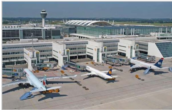
Flugzeuge verschiedener Airlines stehen am Terminal 2 des Münchner Flughafens.

Die Flughafen München GmbH nutzt ein Ausschreibungsverfahren um im Rahmen des Programms „IT Service Management 2020“ das bestehende Servicemodell einschließlich ITSM-Tool zu erneuern. Die Santix AG wurde ausgewählt, Ausschreibung und Toolevaluation zu begleiten.